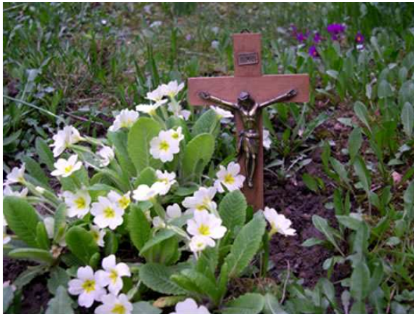
Bloemen spreken van geloof en hoop en liefde.

Ons gevoel en ons hart reiken tot voorbij de horizon van ons verstand. Het gevoel en het hart spreken een eigen taal. Het is de taal van het lied, het gedicht, het verhaal, het gebaar.