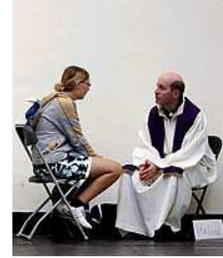
Het sacrament van de verzoening

Wij mensen kunnen ons soms heel schuldig voelen onder iets wat we gedaan hebben. We kunnen ons van dit gevoel bevrijden. Bij een priester kunnen we het hart luchten. Hij zal ons toezeggen dat we als nieuwe mensen verder kunnen leven. God is een vergevende God. Vaak meer vergevend dan wij mensen.