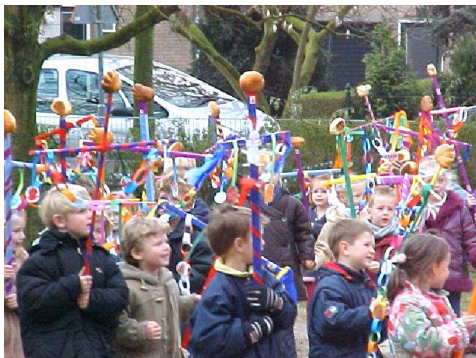
Liturgie die de straat op gaat; kinderen versieren een simpel kruis tot een symbool van leven.